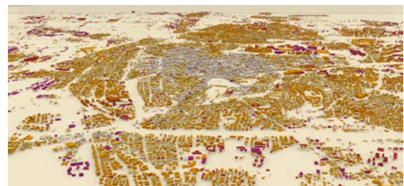
Rappresentazione dell'edificato di Padova, 2007. Tratto dalla tesi di laurea di Luigi Forlin, 2016.

In passato due studenti dell'Università di Padova hanno effettuato un breve periodo di scambio a Nagoya per finalizzare la loro tesi. Un primo lavoro ha riprodotto in GIS l'evoluzione del comune di Padova dal 1900 ai giorni nostri, differenziando gli edifici per tipologia, evidenziando trend edilizi e fornendo utili informazioni circa processi di demolizione. Una seconda tesi ha ricreato in dettaglio