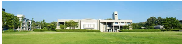
Toyoda Auditorium, iconico edificio fulcro del campus.

Nagoya University è una delle sette università imperiali del Giappone, fondata nel 1939, e velocemente diventata una delle migliori università del paese, e conta tra i suoi ranghi 6 premi Nobel. Conta circa 15.000 studenti, di cui il 10% è internazionale. L'università è dotata di un grande campus nei pressi del centro città, fornito di vari comfort: una fermata della metro interna al campus, sportelli automatici bancari (ATM), un ufficio postale, diverse mense, 2 ristoranti, e 5 caffè.